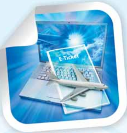
DEMLINK | ONLINE