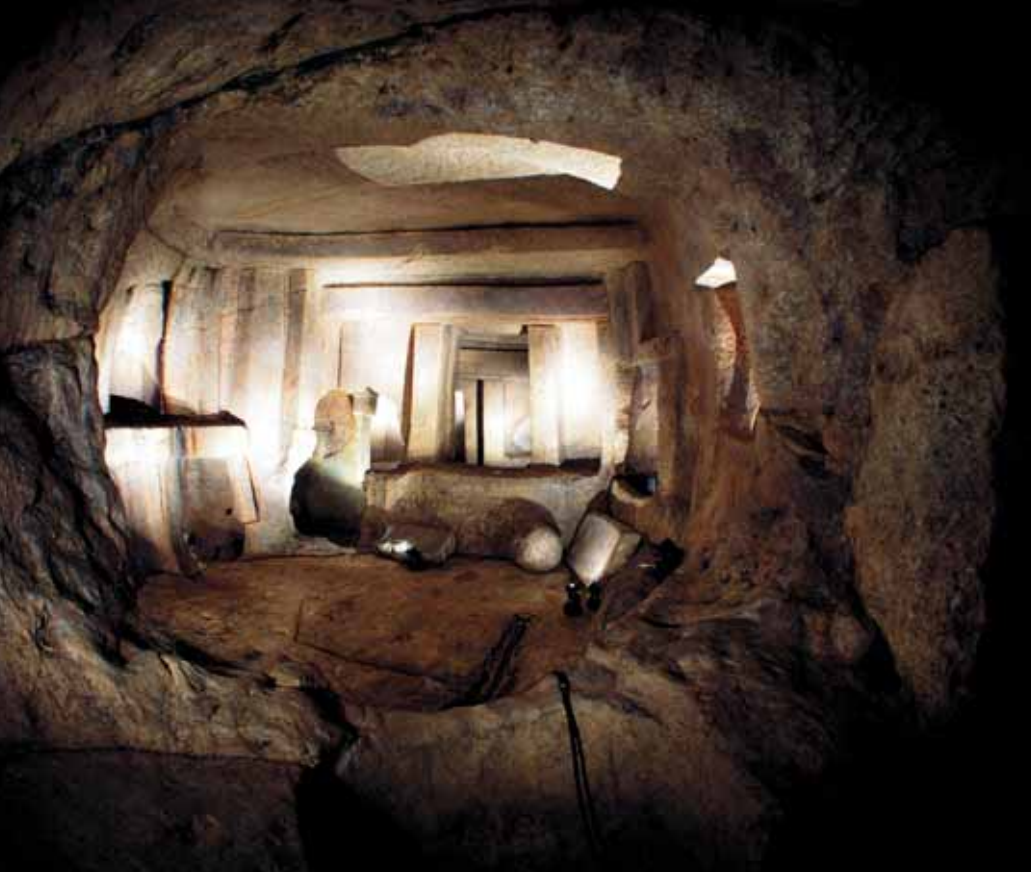
Гипогей – самое известное мальтийское подземелье