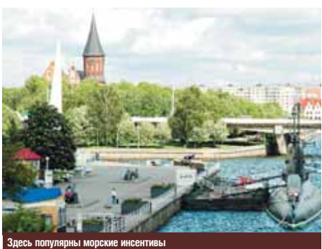
Здесь популярны морские инсентивы