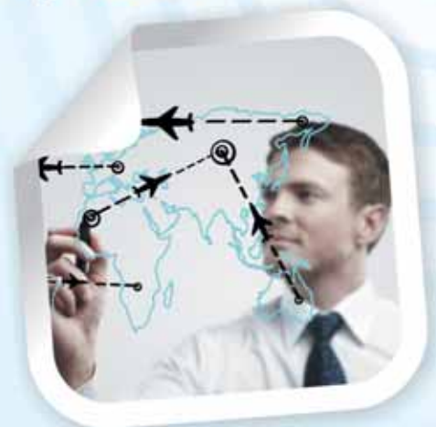
DEMLINK | CLUB