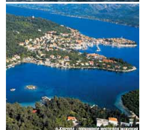
о. Корчула – популярное место для экскурсий