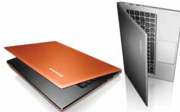
Габаритные размеры: 324x216x14,9 мм Вес: 1,32 кг Цена: от 36 000 руб.