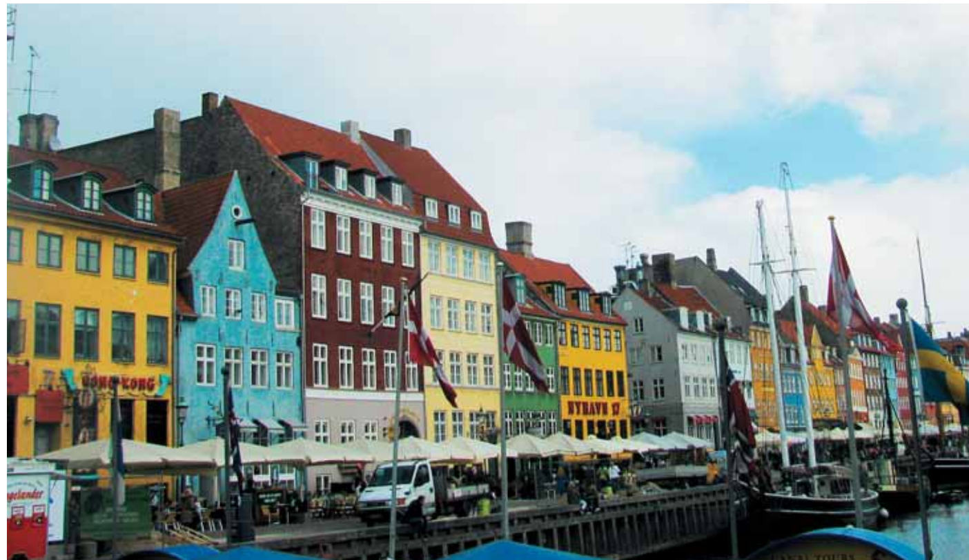
Новая гавань, портовый район Копенгагена