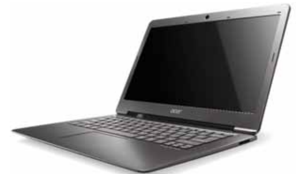
Габаритные размеры: 323x219x17,5 мм Вес: 1,4 кг Цена: от 27 500 руб.