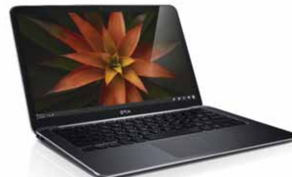
Габаритные размеры: 316x205x6-18 мм Вес: 1,36 кг Цена: пока нет в продаже

Плюсы: легкий и тонкий; цена. Минусы: малое время автономной работы.