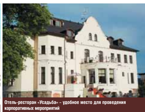
Отель-ресторан «Усадьба» – удобное место для проведения корпоративных мероприятий