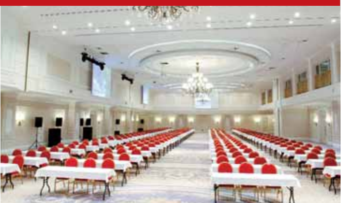
Worldhotel Soltanat Almaty