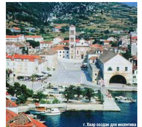
г. Хвар создан для инсентива

Правительство Республики Хорватия приняло решение об отмене виз для граждан России, Украины, Казахстана и Азербайджана в период с 01 апреля по 31 октября 2012 года. В указанный период для въезда и пребывания на территории Хорватии гражданам этих стран необходимо только действующий загранпаспорт, ни ваучер, ни приглашение не требуется. Окончание срока действия паспорта может совпадать с окончанием поездки.