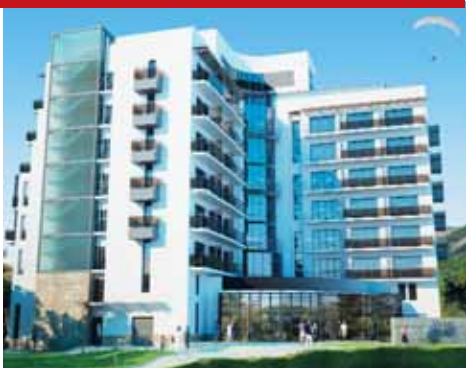
SPA Hotel & Wellness Primorie, г. Геленджик