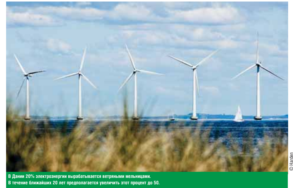
В Дании 20% электроэнергии вырабатывается ветряными мельницами. В течение ближайших 20 лет предполагается увеличить этот процент до 50.

Прежде всего, это новый, открывшийся в мае 2011 года отель и конгрессный центр Bella Sky – самый крупный отель в Скандинавии. Он представляет собой две огромные 24-этажные башни, стоящие в виде буквы V и соединенные мостом-переходом. В одной из башен расположен собственно отель, а в другой – конгрессный Bella Center.