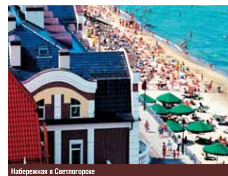
Набережная в Светлогорске

в XIII в., покорив язычников-пруссов и основав свое государство, которое со временем преобразовалось в Прусское герцогство. В конце концов в 1772 г. оно превратилось в Восточную Пруссию с центром в городе Кенигсберге, которому суждено было после Второй мировой войны превратиться в Калининград. В 1946 г. по решению Берлинской (Потсдамской) конференции две трети территории Восточной Пруссии были переданы Польше, а одна треть, территория, прилегающая к Кенигсбергу, стала Калининградской областью. Кенигсберг был основан в 1255 г. на месте прусской крепости Твангсте. В Калининграде сохранилось множество памятников истории, архитекту-