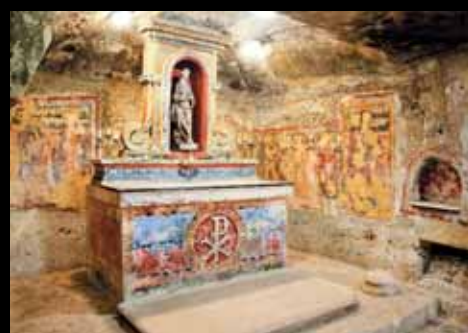
Рабат. Катакомбы Св. Агаты

В Гипогее была найдена статуэтка Спящей леди (Sleeping Lady) – лежащей на боку женщины пышных форм. «В рост» она около 20 см. Это важнейший исторический артефакт Мальты, символ ее древней культуры. Доступ в Гипогей ограничен – дыхание посетителей увлажняет воздух и вредит стенам Гипогей. Поэтому экскурсию сюда надо заказывать за одну-две недели в зависимости от сезона.