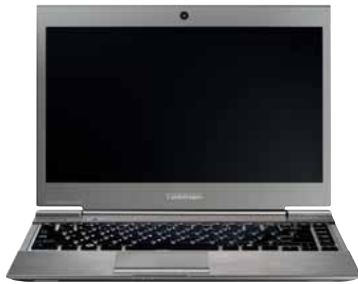
Габаритные размеры: 316x227x8,3-15,9 мм Вес: 1,12 кг Цена: от 39 500 руб.