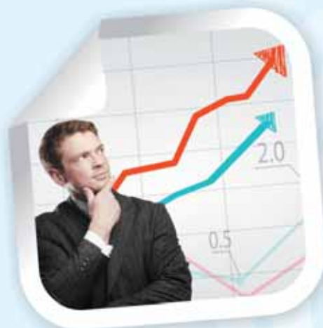
DEMLINK | MONEY