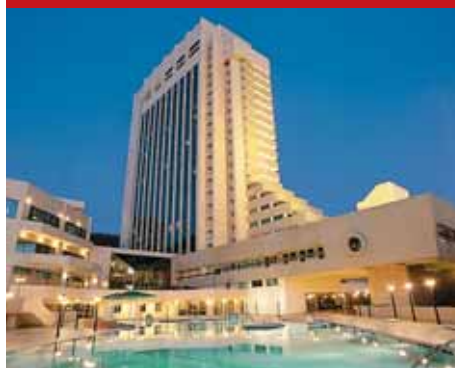
Radisson Lazurnaya Hotel Sochi, г. Сочи