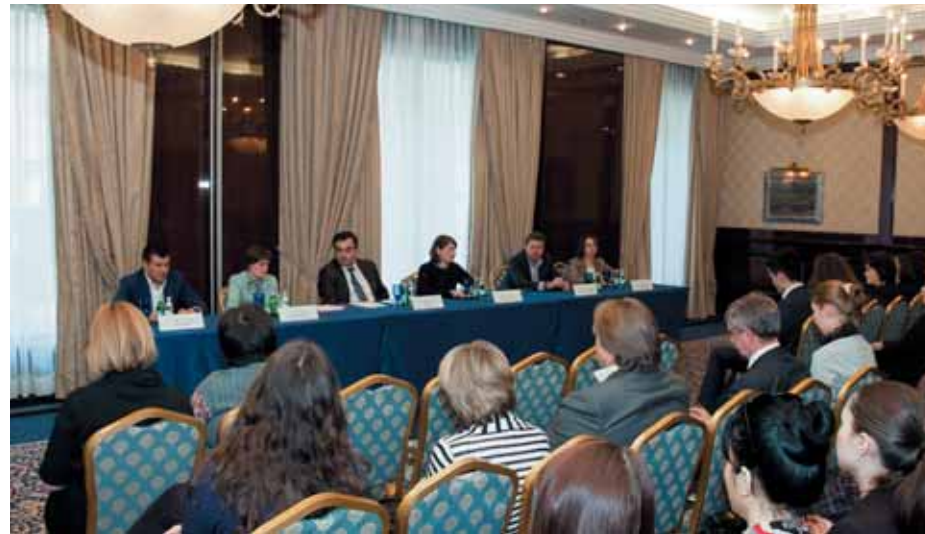
Пресс-конференция вызвала большой интерес в отрасли