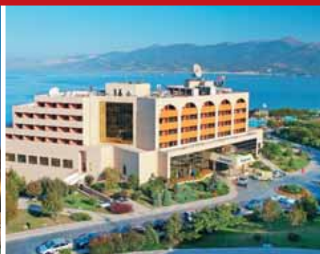
«Надежда SPA & Морской Рай», г. Геленджик