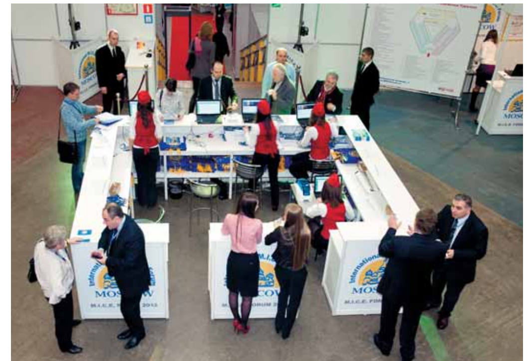
MICE Forum собрал более 90 компаний-участниц