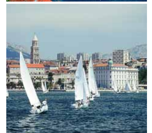
Морские регаты – прекрасная возможность для тимбилдинга