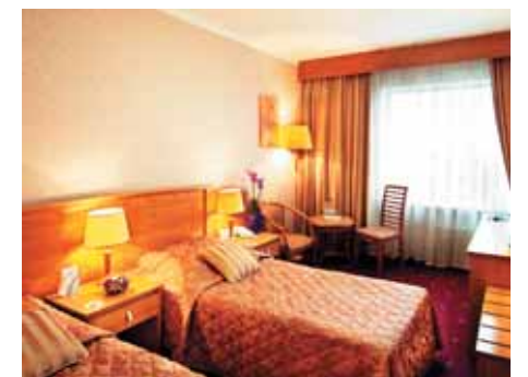
Стандартный номер отеля