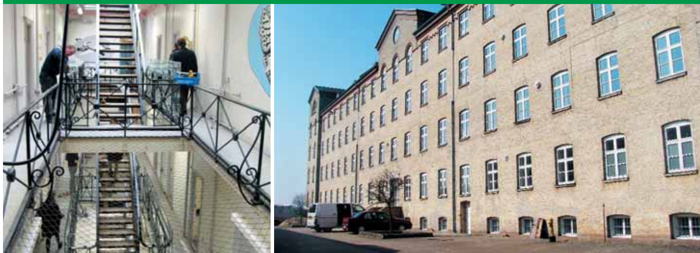
Бывшая тюрьма Fanglest – нестандартная ивент-площадка