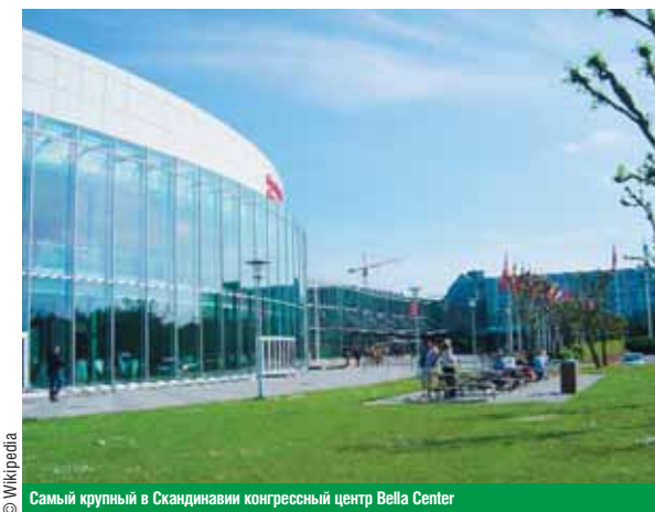
Самый крупный в Скандинавии конгрессный центр Bella Center

Деловые столичные «зеленые» отели Копенгаген в состоянии предложить своим гостям отели на любой вкус – большие и маленькие, разнообразных стилей и ценовых категорий. Деловым путешественникам будут интересны прежде всего два крупных бизнес-отеля, находящихся недалеко от международного аэропорта и способных принять не только гостей с самыми разными вкусами, но и крупные деловые мероприятия.