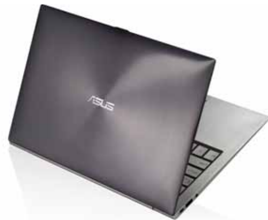
Габаритные размеры: 325x223x3,17 мм Вес: 1,3 кг Цена: от 43 000 руб.

Минусы: нет подсветки клавиатуры; нет картридера.