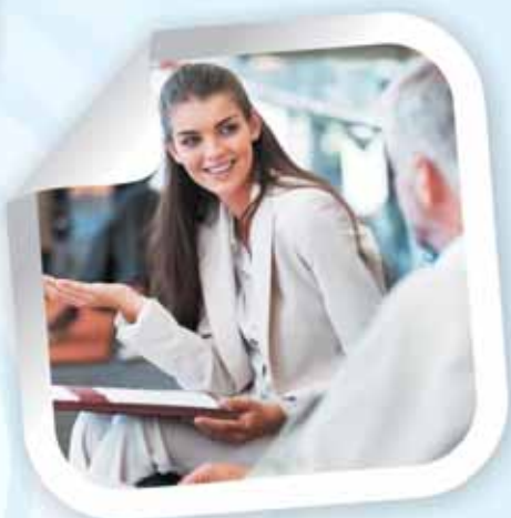
DEMLINK | MICE