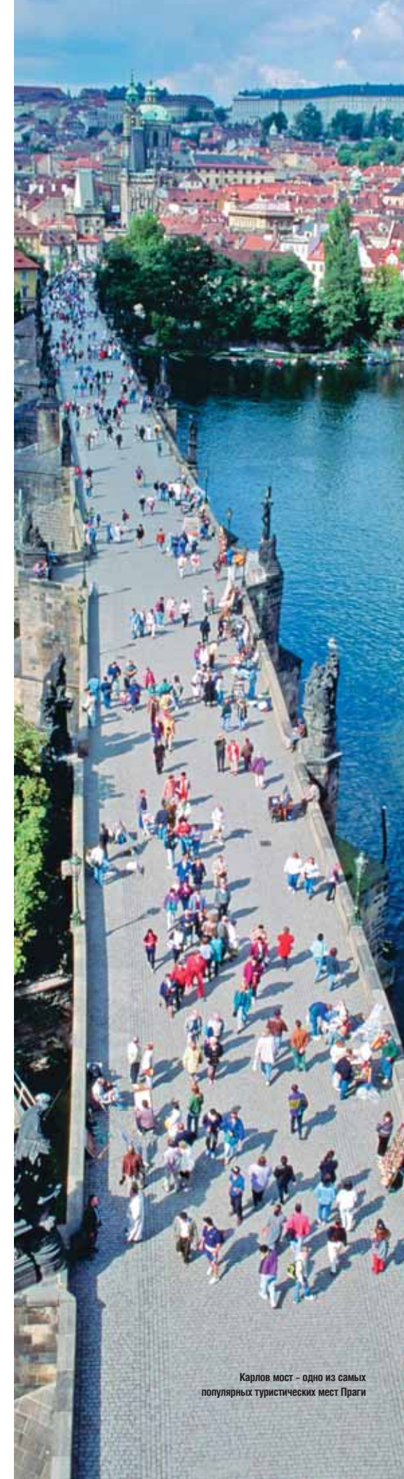
Карлов мост – одно из самых популярных туристических мест Праги

Прага располагает редкими возможностями совмещения приятного с полезным. Где еще можно не только провести серьезное мероприятие на самом высоком уровне, но и сделать это в старинных интерьерах с последующим полным «погружением» в средневековую эпоху, вкушая блюда великолепной чешской кухни? В Праге и окрестностях есть множество древних замков, где подобные желания воплощаются в жизнь. В центре Праги на Славянском острове стоит великолепный дворец Жофинс, здесь можно качественно провести любое мероприятие – от семинара до гала-ужина и даже бала. В непосредственной близости от Пражского Града расположен Мартиницкий дворец. В Большом зале дворца находится капелла с подлинными потолочными рисунками, снаружи украшенная фресками XVI в., причем зал вмещает до 200 человек. Тройский замок на окраине Праги также хорошо подходит для проведения крупных мероприятий – участники надолго запомнят его монументальную лестницу со скульптурами и парк во французском стиле. В 50 км от Праги находится Збигор – старейший дворянский замок Чехии. Здесь есть не только залы для проведения мероприятий, вмещающие до 800 человек, но и четырехзвездные номера. Сочетание барочной архитектуры и конференц-центра с залом на 100 человек – в замке Либлице. Здесь также есть