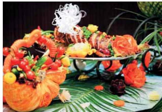
В ресторанах отеля представлены самые разные кухни: от русской до арабской

Конечно. Мы, например, всегда спрашиваем, как клиент узнал о нас. Так вот, 15% наших гостей приходят к нам по рекомендации тех, кто у нас уже останавливался, участвовал в мероприятиях, то есть наших клиентов. У нас высокий процент лояльных гостей.