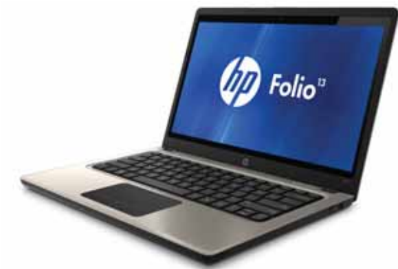
Габаритные размеры: 318,5x220,2x18 мм Вес: 1,5 кг Цена: от 38 000 руб.