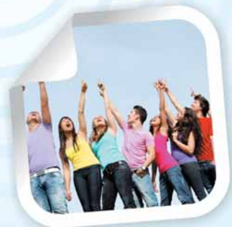
DEMLINK | PEOPLE

Генеральный директор: Иван Капашников Шеф-редактор: Александра Загер Шеф-редактор тематических выпусков: Александр Попов Редактор: Элеонора Арефьева Корреспонденты: Полина Бойцова Елена Смирнова Михаил Тимонин Анна Юрьева Корректоры: Ольга Помелова Марина Мартынова Художники: Светлана Обуховская Владислав Суворегин Фото на обложке: Михаил Тимонин Фотографии: Михаил Тимонин Александр Сайганов Отдел рекламы: Ольга Мальцева Наталья Далевиц Евгения Шуманская Отдел информации и распространения: Лариса Тарасюк Людмила Сивова Виктория Кудряшова Алеватина Корева