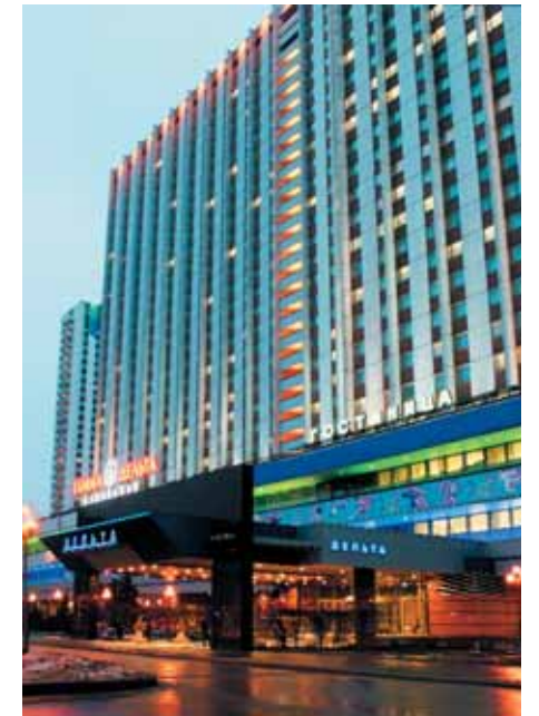
Вход в отель «Дельта»

Вообще, во всем, что касается реновации, полагаемся на мнение гостей, проводим анкетирование, общаемся с клиентами. Никто, кроме гостя, не скажет лучше, что ему необходимо. И мы на это мнение всегда стараемся ориентироваться. ■