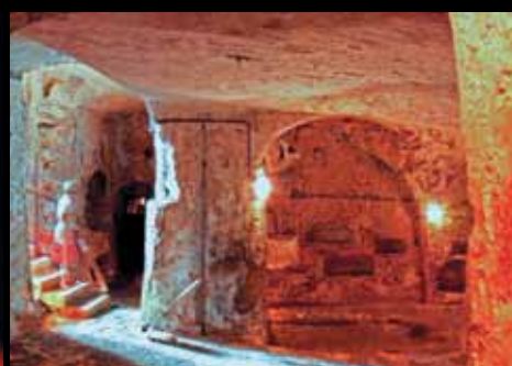
Рабат. Катакомбы Св. Павла