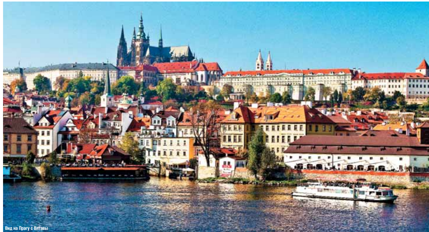
Вид на Прагу с Влтавы