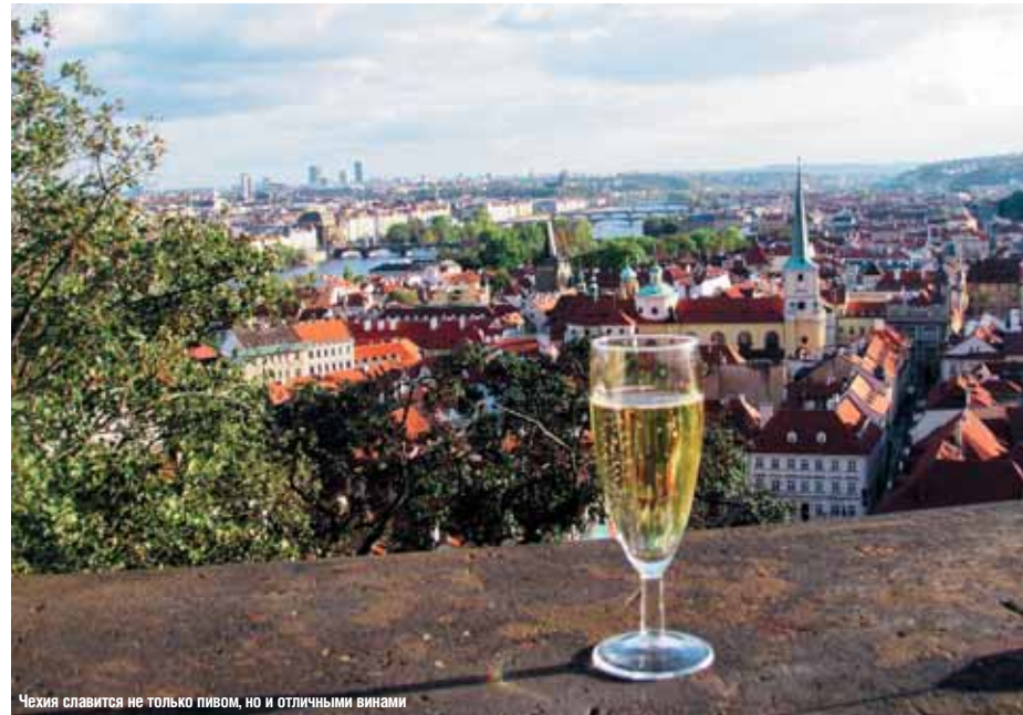
Чехия славится не только пивом, но и отличными винами

возможность разместиться в двухместных номерах и отдохнуть в велнес-центре.