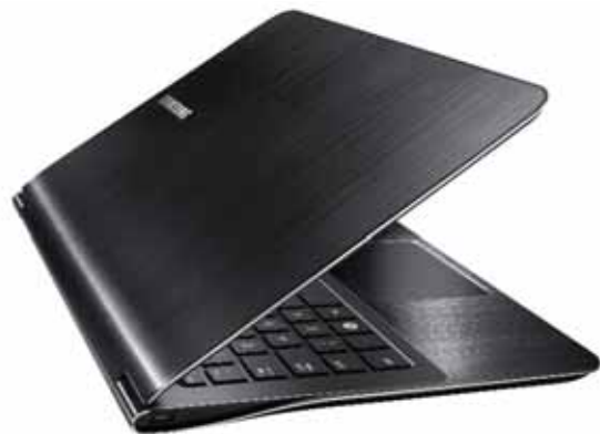
Габаритные размеры: 328,5x227x15,9-16,3 мм Вес: 1,31 кг Цена: от 35 000 руб.