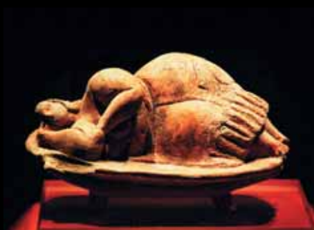
Спящая леди – символ древней культуры Мальты